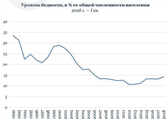
Таблица 1. Динамика уровня бедности в России (1992–2018 г.г.)