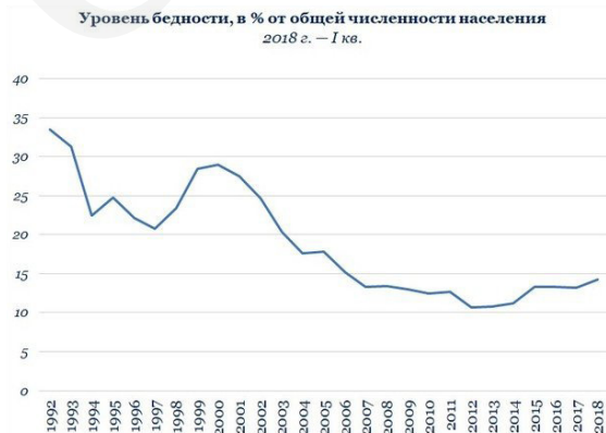
Таблица 1. Динамика уровня бедности в России (1992–2018 г.г.)