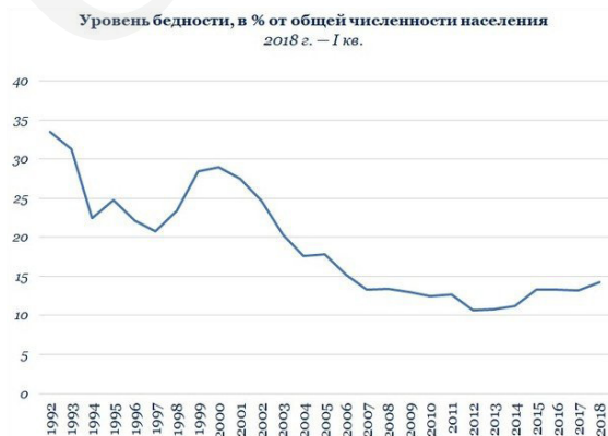
Таблица 1. Динамика уровня бедности в России (1992–2018 г.г.)