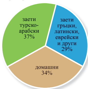
Графика 1. Процентно съотношение на имената в речника според произхода им.

В смолянската личноименна система се откриват всички видове лични имена по значение според класификацията на Н. Ковачев (Ковачев 1987).